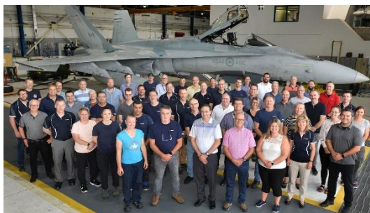
L'équipe du SES se compose de 1 100 employés et opère depuis ses installations situées sur 13 sites à travers le Canada. Photo prise lors de la livraison du premier avion HEP.

Afin d'assurer un soutien maximal pour les avions de chasse, le personnel aux installations de L3Harris à Halifax, en Nouvelle-Écosse, se charge également de la réparation et révision des écrans d'affichage du F/A-18, un service dont dépendent autant la U.S. Marine Corps que l'ARC.