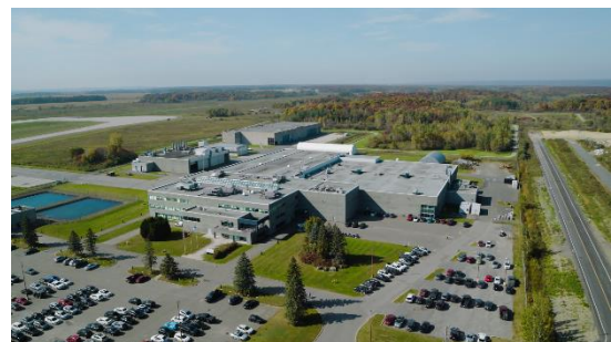
Les installations de troisième échelon de L3Harris situées à Mirabel, au Québec.

L'équipe du SES se compose de 1 100 employés dévoués et passionnés, dont 250 personnes spécialisées et hautement expérimentées ayant été intégrées aux escadrons de l'ARC dans 10 bases canadiennes ainsi qu'aux Gestionnaires de systèmes d'armes du Quartier