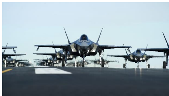
L3Harris est bien placé pour poursuivre sa contribution avec le prochain chasseur canadien, le F-35 Lightning II.